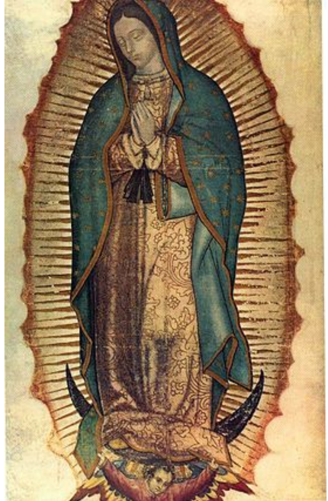
Unsere Liebe Frau von Guadeloupe, Mexiko عكس مريم مقدس گواديلوپ. مكزيكو