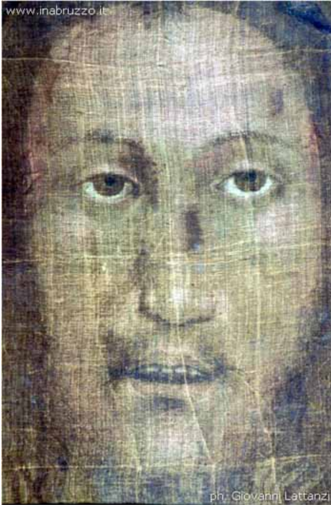
Volto Santo von Manopello ولتو سانتو منوپيلو